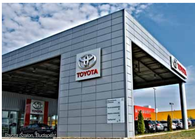
Toyota Szalon, Budapest

különböző szélességi és magassági méretekben, többféle bevonat és szín közül választható ki az épülethez és a vevői igényekhez legjobban illeszkedő kazettás burkolat. A kazettákkal együtt az egyedi sarokmegoldások és illesztések adják meg a termék tökéletes homlokzati összhangját.